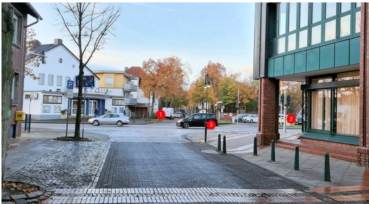
Schaubild 1: Sicht aus der Bachstraße

Zur Überquerung der unübersichtlichen Kreuzung Groner Allee / Bachstraße / Weberstraße mit Abbiegespuren existiert für Fußgänger eine Anforderungsampel (2) . Diese Anforderungsampel kann, von der Fahrradstraße Groner Allee kommend, bequem mit dem Anforderungstaster (1) bedient werden. Von der Bachstraße kommend besteht für Radelnde keine Möglichkeit, die Ampel zu bedienen, ohne vom Rad abzusteigen oder den Fußgängerverkehr zu kreuzen. Der Laternenmast (3) bietet sich für eine Anforderungstaste an: