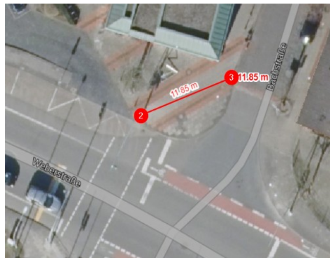
Schaubild 3: Luftbild

Der Aufwand für eine Anforderungstaste an der vorhandenen Laterne (3) sind sehr übersichtlich, da die Anforderungstaste für Fußgänger am vorhandenen Ampelmast (2) nur ~ 12 m vom Laternenmast (3) entfernt ist.